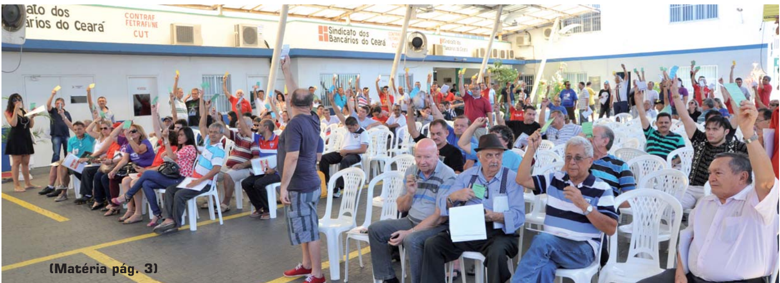
(Matéria pág. 3)

BB: Sindicato indica voto na Chapa 3 – Compromisso com Associados nas eleições da Previ. Não esqueça de votar, você tem até o dia 27/5