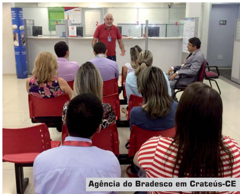
Agência do Bradesco em Crateús-CE

“A falta de funcionários, além de levar ao adoecimento dos bancários, faz também