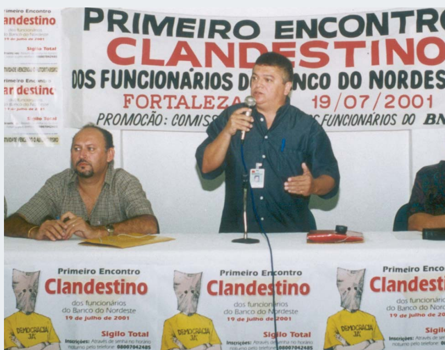
Reflexo da resistência durante a era Byron: até os encontros dos funcionários era feito de maneira clandestina

CAMPANHA SALARIAL – Após 21 dias de greve, a CNFBNB/Contraf-CUT se esforçou no sentido de preservar o processo negocial e arrancou alguns avanços, principalmente relativos à PLR e ao abono de R$ 500,00 (tributável quanto ao imposto de renda). Após reivindicação da CNFBNB para que fossem encontradas alternativas que compensassem o funcionalismo quanto ao limite de 9% imposto pelo Departamento de Coordenação e Governança das Empresas Estatais (DEST) para distribuição da PLR, o Banco propôs, adicionalmente, adiantar, nos moldes do empréstimo de férias, 1/3 da re-