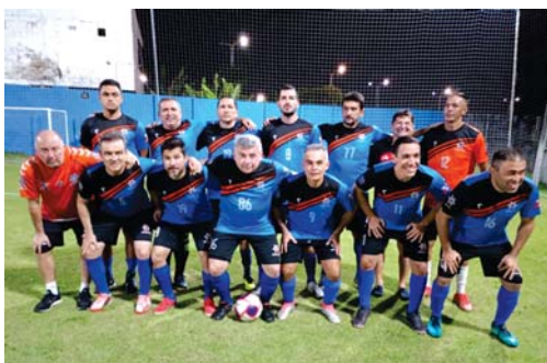
BNB x APCEF disputarão a final do Campeonato Master dos Bancários