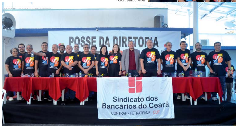
A Solenidade de Posse da nova diretoria aconteceu no dia 28/8, Dia do Bancário, na Sede do Sindicato dos Bancários

A eleição foi realizada durante os dias 4, 5 e 6 de julho e a Chapa 1 recebeu a aceitação de 96,36% dos votantes, um total de 3.724 votos dos 3.854 votos válidos. Foram registrados ainda 108 votos brancos (2,8%) e 22 votos nulos (0,57%).